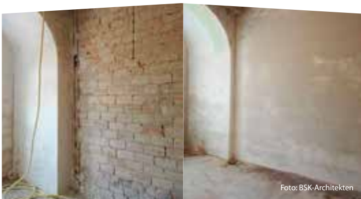
Dathe-Gymnasium, Erneuerung schadhafter Putzflächen, vorher und nachher

Die Baumaßnahme umfasst die Grundsanierung des straßenseitigen Gebäudeteils zwischen den Treppenaufgängen A und D vom Erdgeschoss bis zum Dachgeschoss. Im Zuge der Sanierung wird die vorhandene Hausmeisterwohnung im Erdgeschoss der schulischen Nutzung zugeführt. Mit der Grundsanierung des vorhandenen Gebäudeteils wird die Flucht- und Rettungswegsituation sowie Brandschutz, Raumakustik und Schallschutz verbessert. Schadstoffe werden im Zuge der Sanierung zurückgebaut. Türen, sowie Wand-, Decken- und Bodenbeläge werden erneuert bzw. saniert. Die Kosten belaufen sich bislang auf 1,94 Mio. Euro, die Finanzierung erfolgt über das Schulsanierungsprogramm (SchulSP).