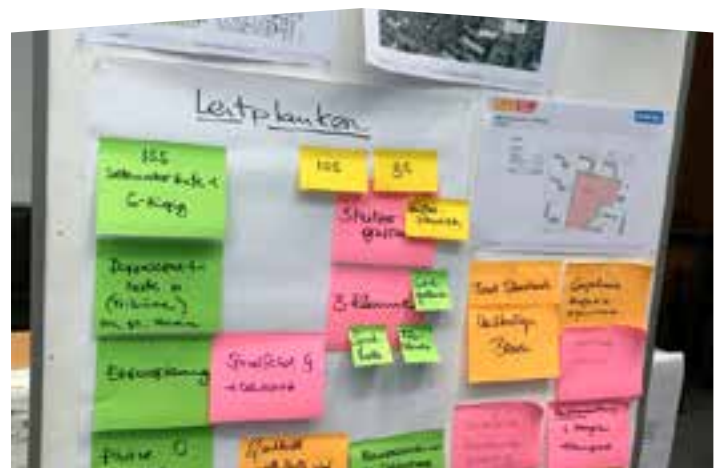
Partizipations-Workshop ISS Eisenacher Straße