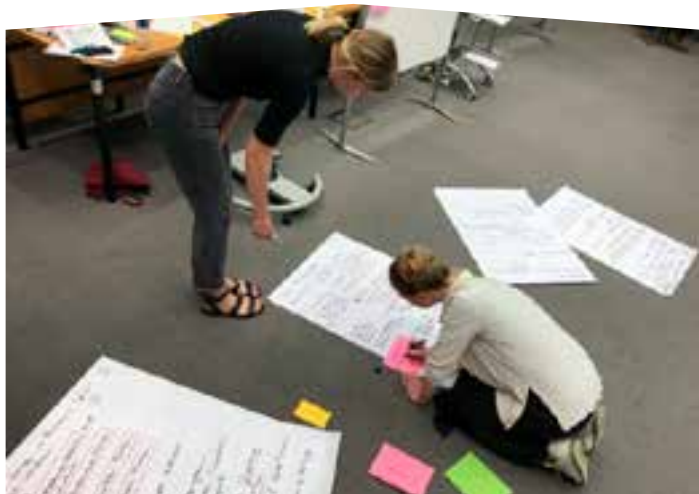
Partizipations-Workshop ISS Eisenacher Straße