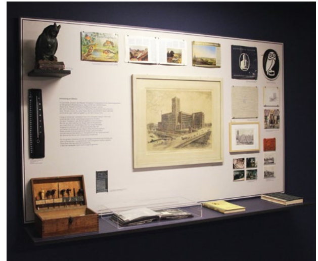
Blick in die Ausstellung – Sammlungsaufruf

Die Ausstellung wirft Blicke auf die Geschichte hinter den Mauern des eindrucklichen Bauwerks, das bis heute die Silhouette von Tempelhof prägt. Ergänzt wird die Wanderausstellung durch zahlreiche Leihgaben und Schenkungen, die Tempelhofer_innen und ehemalige Mitarbeiter_innen des Ullsteinhauses dem Museum im Rahmen eines Sammlungsaufrufs überließen.