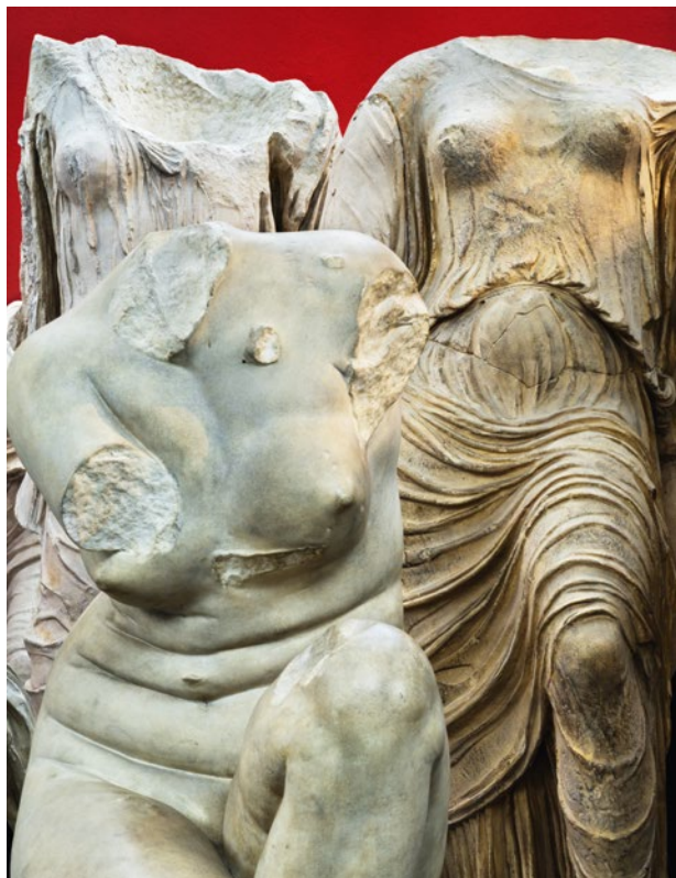
Amin El Dib, IMG-1496, aus der Serie Von der Brüchigkeit des Seins