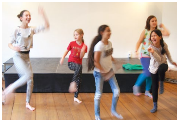
Tanz-Workshop im Jugend Museum; Foto: Christian Burnowski

Wir experimentieren mit Bewegungen, schlüpfen in andere Rollen und tanzen in verschiedenen Kostümen. Inspiriert von der Ausstellung entwickeln wir im Lauf der Woche gemeinsam ein Tanzstück. In der Werkstatt könnt ihr malen, Requisiten herstellen und ein Bühnenbild bauen.