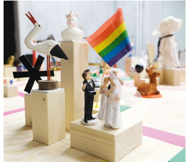
Blick in die Ausstellung, Foto: Museen Tempelhof-Schöneberg

Begleitprogramm: in der neuen Kalenderübersicht und unter www.museen-tempelhof-schoeneberg.de/termine-allgemein.html