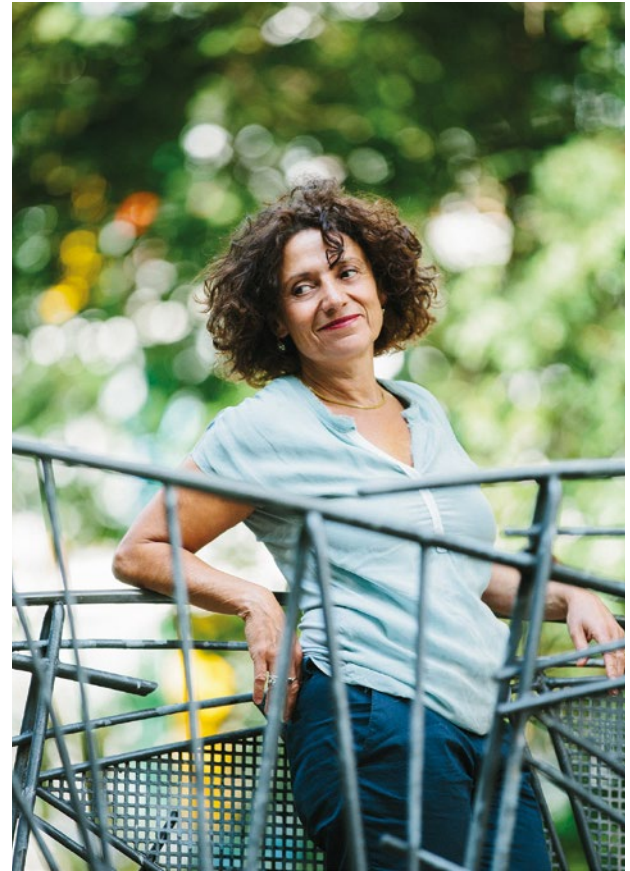
Adriana Altaras

Ort: Mittelpunktbibliothek »Theodor-Heuss-Bibliothek«, Hauptstraße 40, 10827 Berlin