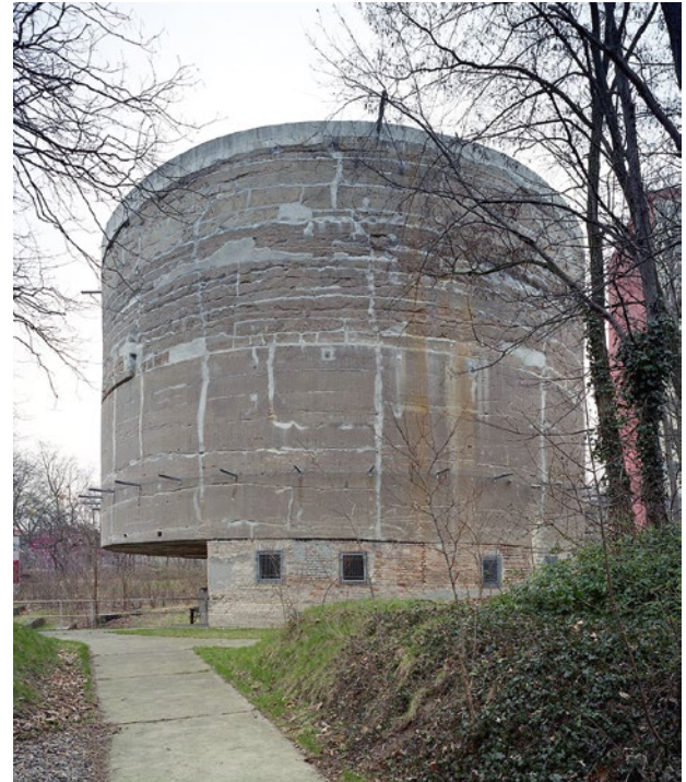
Informationsort Schwerbelastungskörper