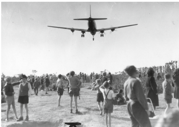
Am 30.9.1949 war das Ende der Berliner Luftbrücke.