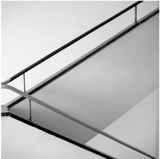
Treppenaufgang mit Handlauf, ©2019 Stefan Berg, VG Bildkunst (Entwurf Walter Gropius) | siehe vorige Seite