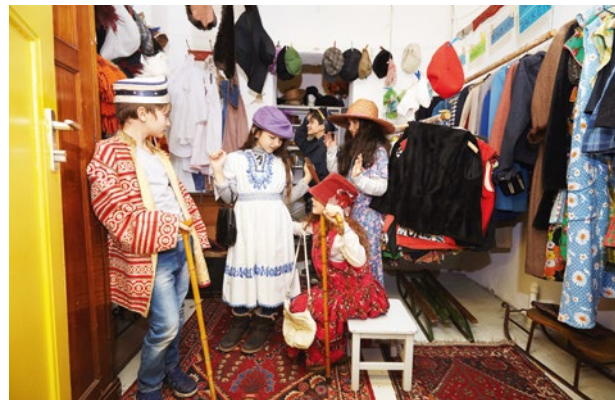
Kinder im Theaterfundus des Jugend Museums

Nähere Informationen dazu finden Sie unter www.museen-tempelhof-schoeneberg.de