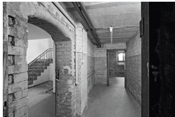
Innenansicht des SA-Gefängnisses vor dem denkmalgerechten Umbau zum Gedenkort 2011 | siehe S. 35

projekt@wirwarennachbarn.de www.wirwarennachbarn.de Telefon 030-90 277 4527