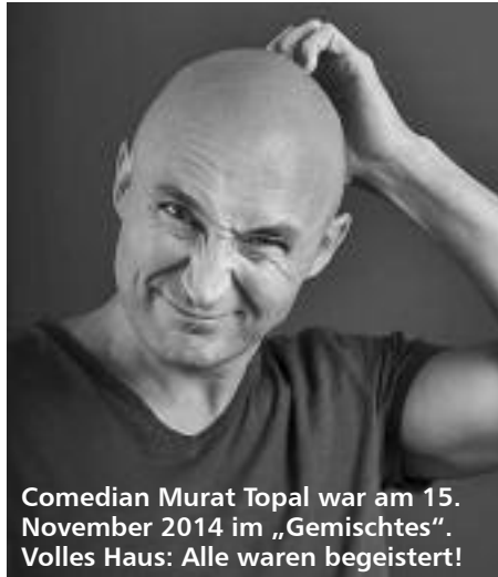
Comedian Murat Topal war am 15. November 2014 im „Gemischtes“. Volles Haus: Alle waren begeistert!

und Mitgliedsbeiträge wir erhalten, desto deutlicher können wir zeigen: Das Kulturzentrum Gemischtes wird in Spandau gebraucht.