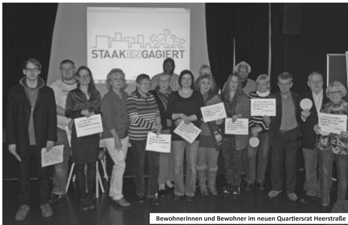
Bewohnerinnen und Bewohner im neuen Quartiersrat Heerstraße

Das Quartiersmanagement wird sich auch weiterhin für den Erhalt und eine aus-