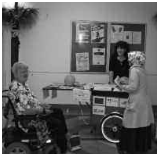
QM-Stand im Staaken-Center

Die Stadtteilversammlung hat als wichtige Handlungsfelder für das Quartiersverfahren Bildung, Gestaltung des Wohnumfeldes, Stadtteilkultur und soziale Infrastruktur