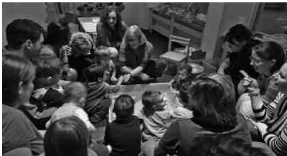
Abb. oben /unten: Bei der offenen Eltern-Kind-Veranstaltung im Café Doppelkeks; rechts: Bastelaktion des Projekts im Staaken-Center

Damit die Herausforderungen im Erziehungsalltag für die meist jungen Eltern eher zu bewältigen sind, gibt es das QM-Projekt von Globale e.V. Der Verein bietet, unter obigem Motto, neben Beratung und Aktionen für Eltern und Erzieher/innen in den beteiligten Kitas, für alle Interessierten mit seinen Rundbriefen „Elterninfo“ Wissenswertes rund um Bildung und Erziehung, Hinweise auf Aktivitäten und Tipps für Experimente, für Basteln und Lernspiele zu Hause.