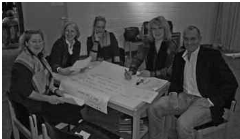
Bei der Auftaktveranstaltung zum Projekt „Bildungsnetz Heerstraße Nord“