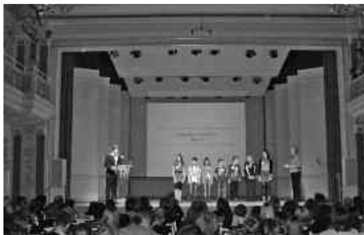
„Stern des Sports“ für Menschen in Bewegung.

Chancen auf dem Arbeitsmarkt“, „Besseres Gesundheitsniveau“, „Steigerung des Sicherheitsempfindens“ als wichtige Ansätze für eine Stabilisierung des Gemeinwesens anerkannt werden. „Soziale und