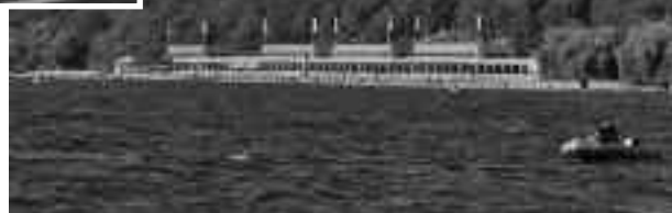
Impressionen einer Dampferfahrt

zwar gering, aber der Spaß mit Celine und die Hilfe, die ich der Mutter dadurch biete, entschädigen für die aufgewandte Zeit.