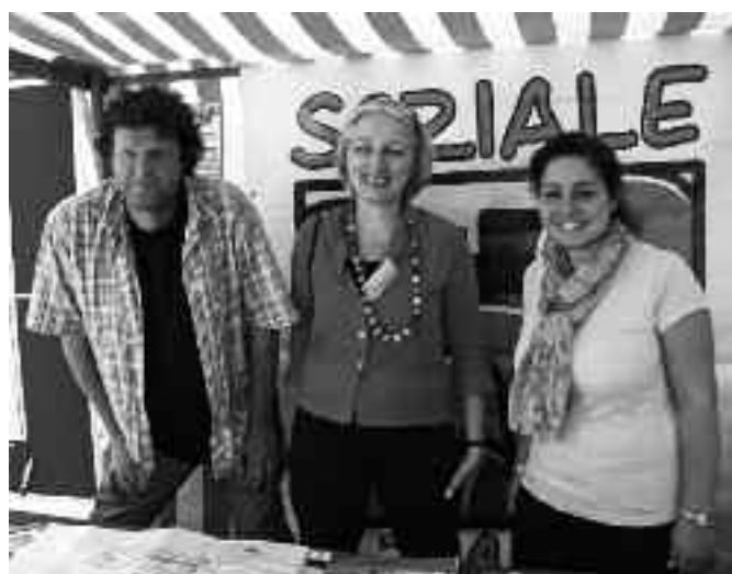
Fast das ganze QM-Team beim Stadtteilfest

Nutzen Sie die vielen schönen Angebote in den Einrichtungen im Stadtteil und machen Sie mit.