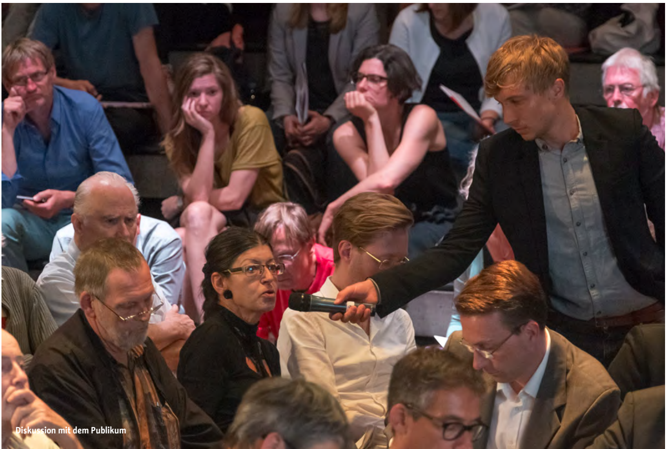
Diskussion mit dem Publikum

„Offene Stadtgesellschaft heißt für mich auch Öffnung über den Zugang zur Natur. Es wird empfohlen, pro Quadratkilometer Siedlungsgebiet ein bis zwei Hektar Naturerfahrungsraum zu integrieren, damit Kinder überhaupt wissen, was Natur ist, wie sie funktioniert und wie sie selber mit Natur interagieren. Die Kinder brauchen aber auch Schulgärten, und zwar an jeder Schule.“