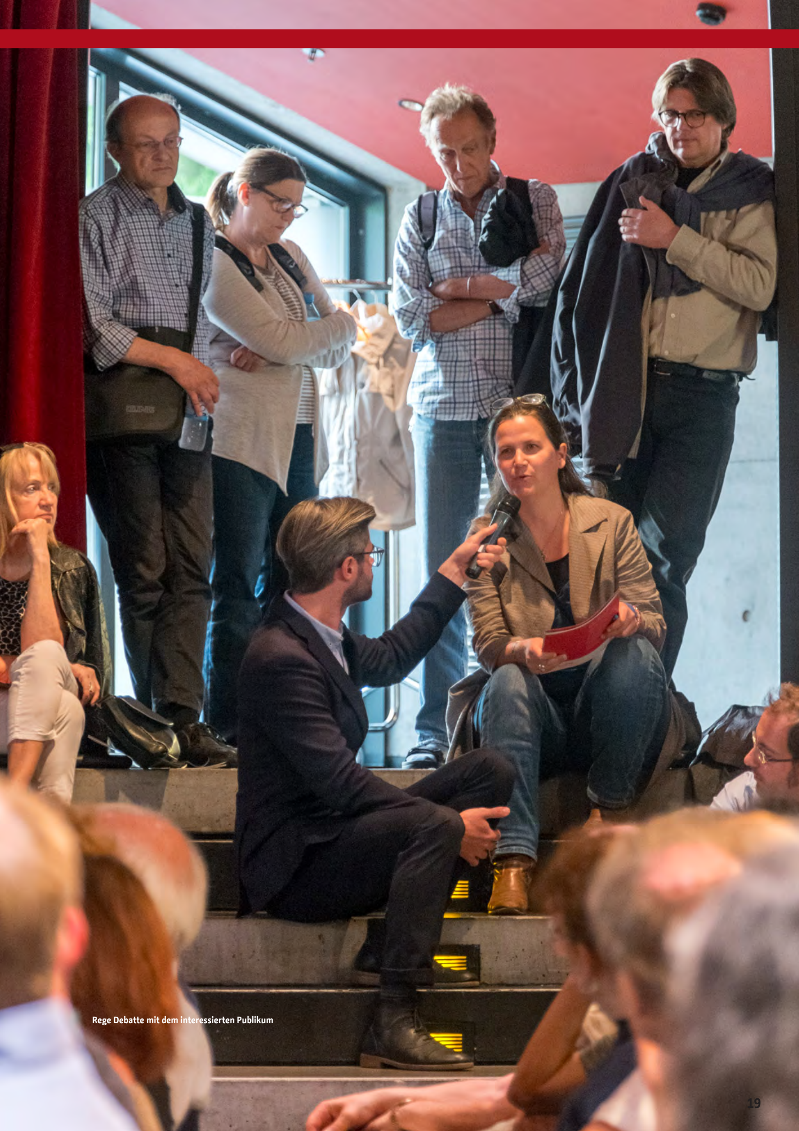
Rege Debatte mit dem interessierten Publikum