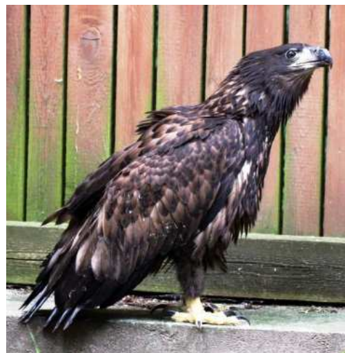
Seeadler (juv., Haliaeetus albicilla )