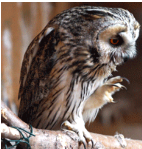
Waldohreule ( Asia otus )

Hervorzuheben ist außerdem die Unterbringung und der Transport von sechs Seeadlern, ein Uhu, vier Wanderfalken, zwei Wespenbussarden, mehreren Waldohreulen und einer Zwergohreule.