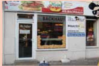
4 HS. Backhaus – Triftstraße 4