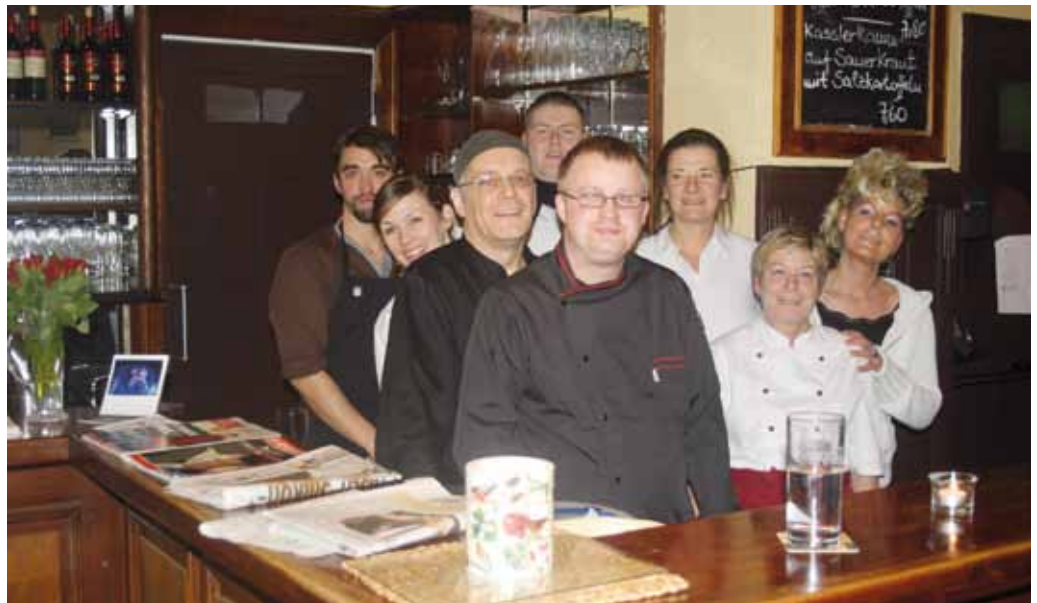
Das Team vom Restaurant Lindengarten

Im August 2011 haben wir es gewagt, die wunderschön gelegenen und historisch geprägten Räumlichkeiten am Nordufer 15 wieder mit Leben zu füllen. Als langjährige Kiezbewohner lag uns dieses Lokal besonders am Herzen. Nach umfangreichen Renovierungsarbeiten und mit viel Unterstützung durch Freunde und Nachbarn ist ein stimmungsvoller Ort entstanden, an dem sich Familien, Generationen, Nachbarn, Weddinggäste, Berufstätige und Freunde treffen und wohl fühlen sollen. Besondere Aufmerksamkeit haben wir der Gartengestaltung geschenkt. Mit Buddelkasten und Sandboden, Rosen und Lavendel, ist eine sommerliche Oase für Groß und Klein entstanden. Der atmosphärisch gestaltete, separate Saal bietet neben zusätzlichen Toiletten und eigener Garderobe aufgrund seiner Größe und technischen Ausstattung Raum für Tagungen, Fortbildungen und Feierlichkeiten jeglicher Art.