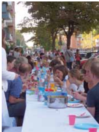
Lange Tafel; Foto: Katja Krüger

Der Quartiersfonds 1 machte 2011 viele Aktivitäten, Aktionen und Verbesserungsmaßnahmen möglich – jetzt gibt es wieder unbürokratisch Geld für den Kiez!