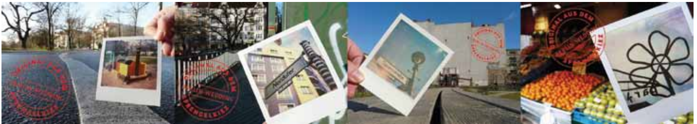
So sehen die neuen kostenlosen Karten aus. Grafik: QM Sparrplatz

W ie wäre es zum neuen Jahr mit einem Gruß aus dem Sprengelkiez? Die originellen Montagen aus Polaroids und „richtigen“ Fotos zeigen einige typische Ansichten aus unserer Nachbarschaft, wie den Sprengelpark oder die Brücke über den Berlin-Spandauer Schiffahrtskanal. Vier Motive stehen zur Auswahl.