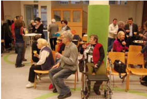
Neujahrsempfang in der Osterkita

A m Sonntag, dem 21. Januar 2012, lud die Osterkirche zum Neujahrsempfang in die Sprengelstraße 35 ein. Die Turnhalle der Osterkita füllte sich und es gab viele interessante Gespräche. Im Anschluss wurden die 2011 renovierten Räume der Osterkita und die Jugend- und Musikräume im Keller eingeweiht.