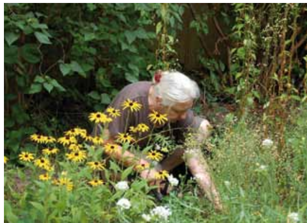
Schulgarten-Aktion; Foto Siemen Dallmann

M öchten Sie etwas für den Sprengelkiez tun und brauchen dafür Geld? Bis zu 15.000 Euro stehen dieses Jahr wieder im Quartiersfonds 1 zur Verfügung. Dieser „Topf“ ist für kleinere Maßnahmen gedacht, die einen Nutzen für den Kiez und seine Bewohner haben. Normalerweise gibt es pro Aktion oder Idee bis zu 500 Euro – in Einzelfällen auch bis zu 1.000 Euro. Gefördert werden ausschließlich Sachmittel, für größere Projekte gibt es weitere Fonds.