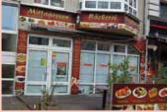
3 Bäckerei – Triftstraße 8