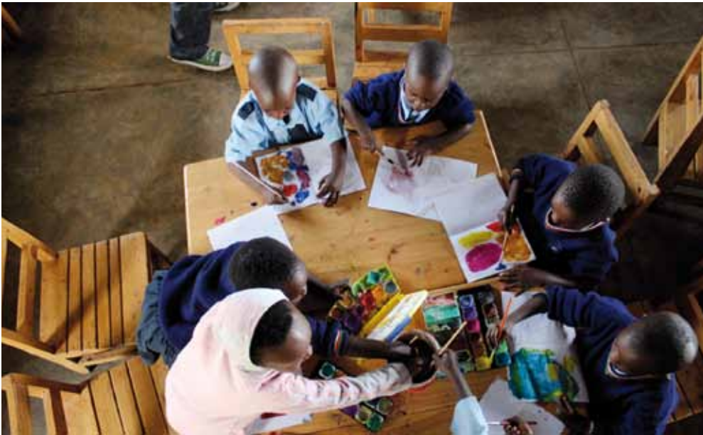
Mal-Workshop mit Kindern in Ruanda

Christophe Ndabananiye wurde als Sohn ruandischer Eltern im kongolesischen Lubumbashi geboren. Er studierte Kunst in Ruanda, Deutschland und auf der französischen Insel La Réunion. Seit nunmehr drei Jahren lebt und arbeitet er im Sprengelkiez – von dem er sich auch inspirieren lässt. Sein Schwerpunkt liegt auf der Malerei, aber auch die neuen Medien bezieht er in Form von Fotografien und Videoaufnahmen in sein Schaffen ein.