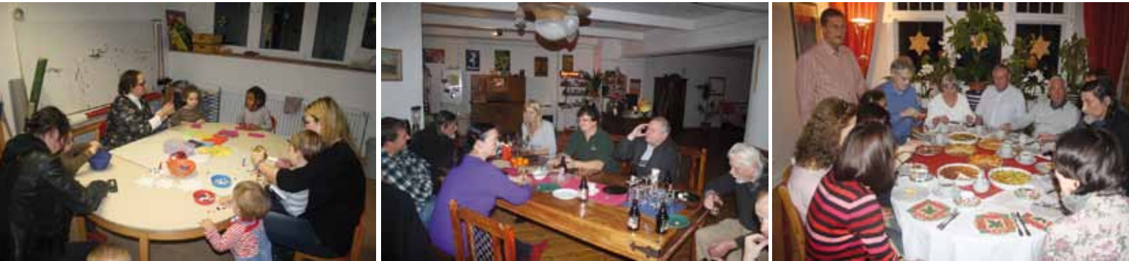
Einige Eindrücke des „Lebendigen Adventskalenders“ 2011

A dvent, eigentlich eine besinnliche Zeit, wären da nicht der Einkaufsstress und die Vorbereitungen auf Weihnachten. Da ist es doch schön, wenn man zumindest einmal am Tag zwei Stunden Zeit hat, sich zu besinnen und den Weihnachtsstress vergessen kann. Der „Lebendige Adventskalender“ im Sprengelkiez, der 2011 zum neunten Mal stattfand, bot allen BewohnerInnen des Kiezes in der Vorweihnachtszeit eine ideale Gelegenheit dazu. Beim „Lebendigen Adventskalender“ öffnen sich echte Türen – Nachbarn treffen sich zum Reden, Essen, Trinken und Kennenlernen.