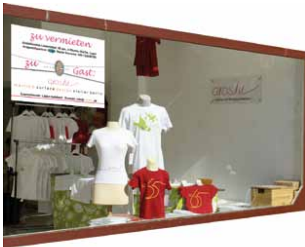
Fenster eines Ladens