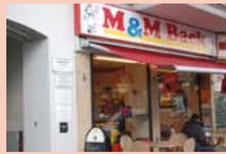
5 M&M Back – Müllerstraße 156a