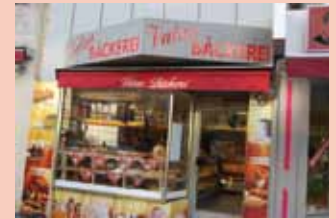
6 Votan Bäckerei – Müllerstraße 156c