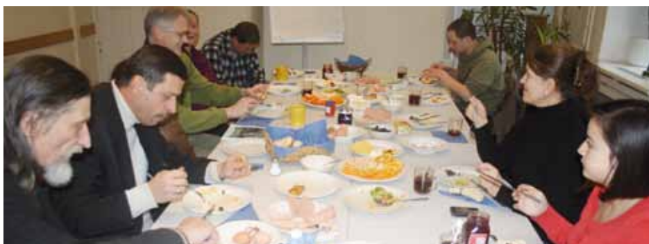
Frühstückstisch im Sprengelhaus; Foto: Siemen Dallmann

Joghurt und anderes Gemüse. Ganz anders sieht es dann wieder in den USA aus, wo das Frühstück aus Süßspeisen wie Cornflakes und Pancakes besteht. Letztere werden jedoch manchmal auch mit Bacon und einer Art Kartoffelpuffer gegessen. Süß ist auch das Frühstück in Brasilien, das zwar selten den Hunger stillt, aber ein Kaffee mit einer riesigen Menge Zucker darf vor dem Weg zur Arbeit nicht fehlen. Wenn dazu dann etwas gegessen wird, dann sind es Kekse mit Butter oder in den nördlicheren und ärmeren Regionen Maniokwurzel in vielen verschiedenen Varianten. Ein traditionelles Frühstück in Vietnam besteht aus einer Reisnudelsuppe mit Rindfleisch, Fisch oder Huhn. Je weiter westlich man blickt, umso mehr stehen dann Eierkuchen mit Bananen oder anderem Obst und Ba-