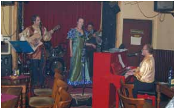
Schlagerkonzert im Ernst

Vorgetragen wird er von Tima der Göttlichen, Andreas Herrmann, Matthias Starck, Wolfgang G. Würtz und Georg. Zu sehen jeden ersten Mittwoch im Monat, im Nachtschwärmer bei Ernst e. V. in der Sprengelstraße 15. Wie gesagt: eine gute Idee, es lohnt sich vorbeizukommen.