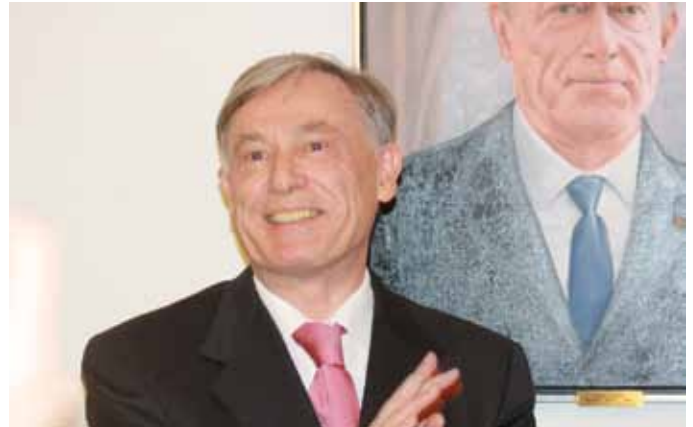
Ex-Bundespräsident Horst Köhler; Foto: AMZ

Der im Mai 2010 wegen der Kritik an seinen Aussagen zu Auslandseinsätzen der Bundeswehr vom Amt des Bundespräsidenten zurückgetretene Köhler äußerte sich nicht zu der aktuellen