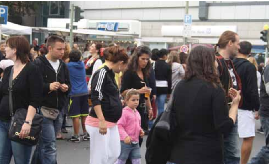
Auf der Müllerstraße

Über 60 Unternehmer rund um die Müllerstraße laden zum 29. Februar mit dem Aktionstag „Ein geschenkter Tag“ in ihre Geschäfte ein.