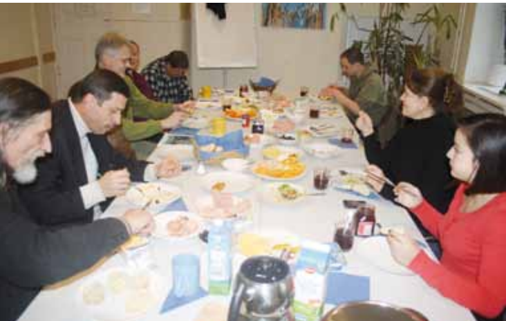
Kiezfrühstück im Sprengelhaus.

Würde man durch die Fenster unserer Kiezküchen schauen, würde man fast jeden Bewohner irgendwann zwischen sechs und zehn Uhr morgens am Tisch sitzen sehen. Nur die wenigsten essen früher, am Wochenende wird aber gerne auch mal später zugeschlagen und schön ausgiebig und lange gebuncht.