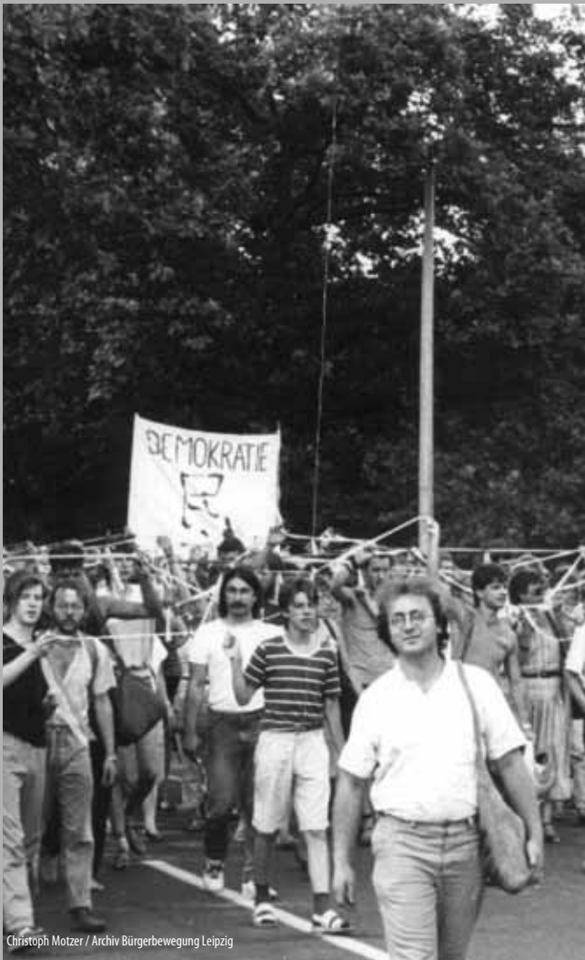
Christoph Motzer / Archiv Bürgerbewegung Leipzig