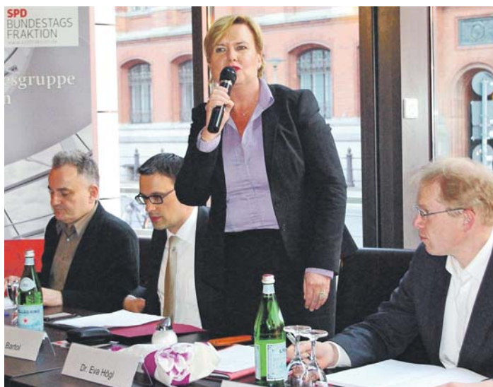
Eva Högl, Bundestagsabgeordnete in Mitte.

Zum einen brauchen wir detaillierte Bestimmungen zum Lobbyismus. Ein Lobbyregister muss eingeführt werden, das deutlich macht, in wessen Namen Lobbyisten handeln und ihre Finanzierung offenlegt. Nur wer diese Bedingungen erfüllt und sich transparent macht, hat in Zukunft Zugang zum Deutschen Bundestag. Ebenso benötigen wir eine „legislative Fußspur“, die aufzeigt,