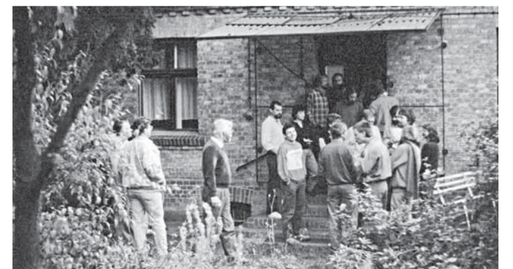
Schwante 1989: Heimliche Gründung der SDP in der DDR.

1989 gründen Sozialdemokraten die erste Partei in der DDR, die dem Machtanspruch der Einheitspartei SED Paroli bietet. Freiheit