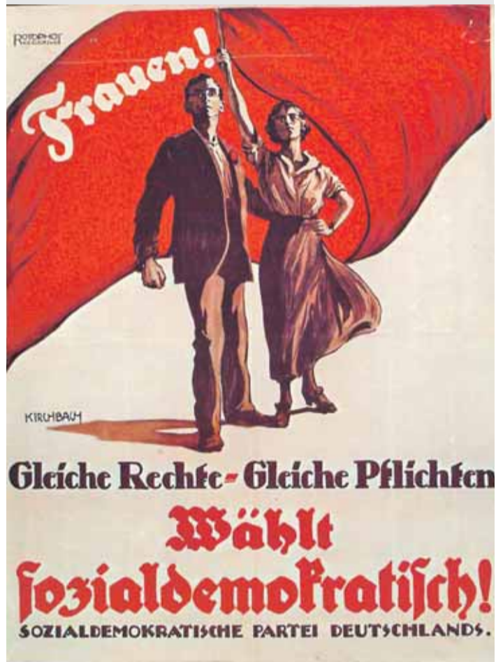
Erkämpftes Frauenwahlrecht: Plakat vom Januar 1919.

Die Sozialdemokratie feiert. Auf das Fest zur Gründung im Mai in Leipzig folgt am 17. und 18. August eine lange Meile der Sozialdemokratie auf der Straße des 17. Juni in Berlin. Freiheit, Gerechtigkeit und Solidarität, diese Werte haben die SPD durch ihre 150jährige Geschichte begleitet. An ihnen lässt sie sich auch immer wieder messen.