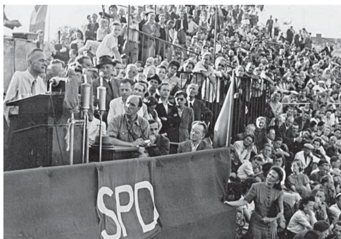
Kampf für die Freiheit: Der SPD-Vorsitzende Kurt Schumacher bei einer Rede auf dem Hertha-Sportplatz in Berlin am 14.8.1947.