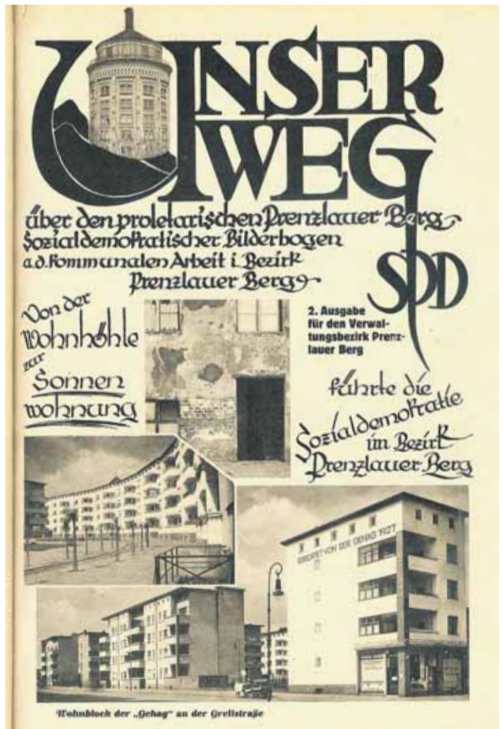
Kommunalwahl 1929: Die SPD präsentiert ihre Erfolge in der Wohnungspolitik.