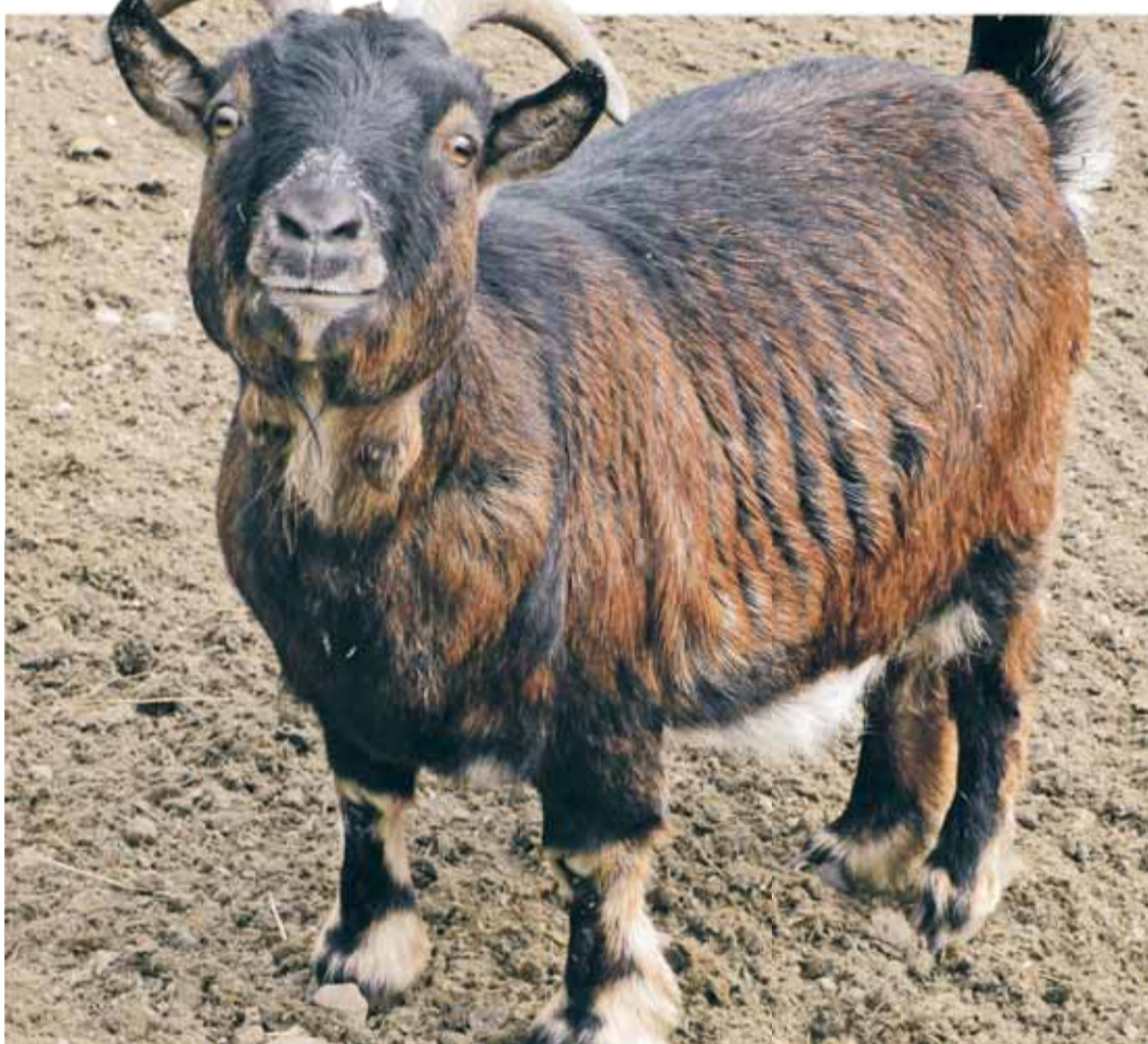
Der Sommer kommt! Ich kenn mich da aus.

Sommer, Sonne, Wasser: Das Baden im Freien ist am schönsten. Wer nicht lange anreisen will, findet in Berlin nicht nur den Wannsee, sondern auch andere Seen, die sogar noch klarer sind. Zum Beispiel den Groß-Glienicker See, den Sacrower See, den Schlachtensee oder den Kleinen Müggelsee. Noch mehr Badespaß kann man in Brandenburg erleben. Der Liepnitzsee und der Wandlitzsee in Wandlitz oder auch