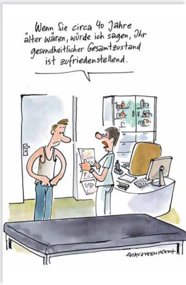
Karikatur: Erich Rauschenbach