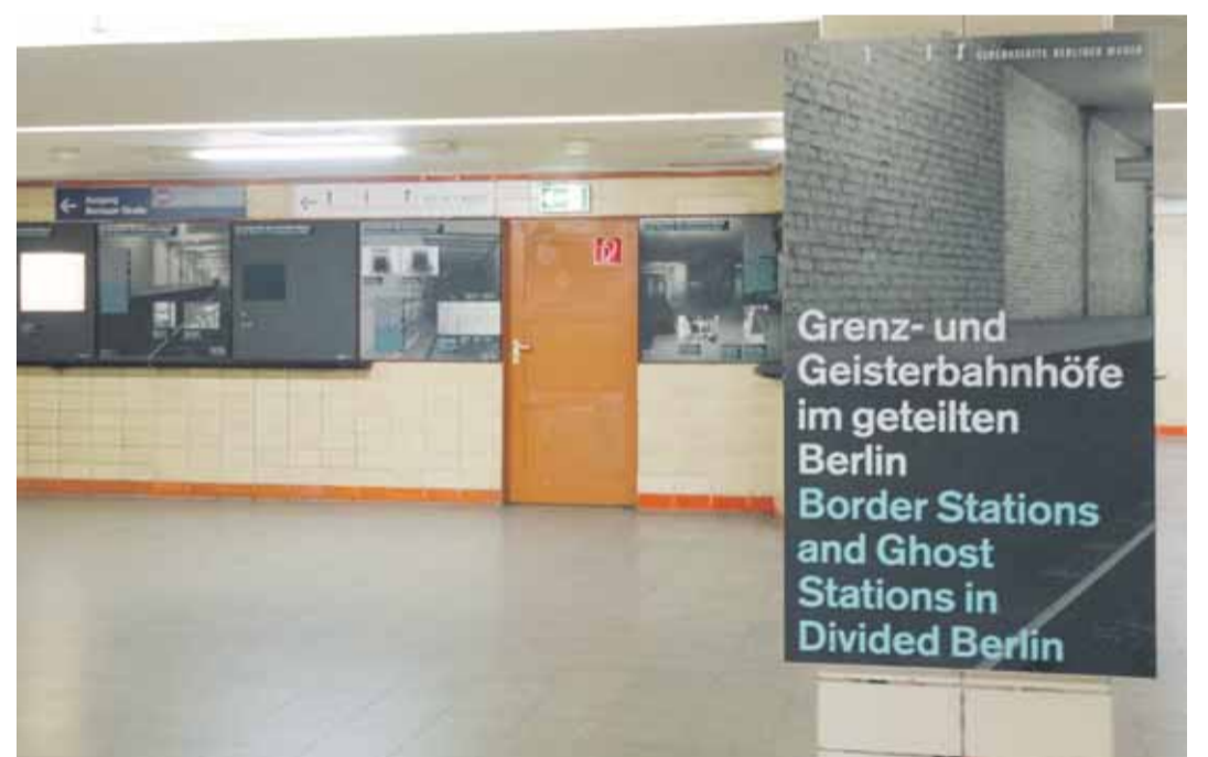
Ausstellung im Nordbahnhof.

AUSSTELLUNGSTIPP: IM UNTERGRUND DES GETEILTEN BERLIN