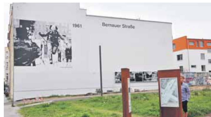
Berliner Mauer: Erinnerung an Mauerbau und Schießbefehl.

Hier spielten sich während des Mauerbaus Szenen ab, die die Welt erschütterten. Menschen seilten sich aus ihren Wohnungen auf die Straße in den Westteil ab, manche sprangen sogar aus den Fenstern. Hier wird an einem