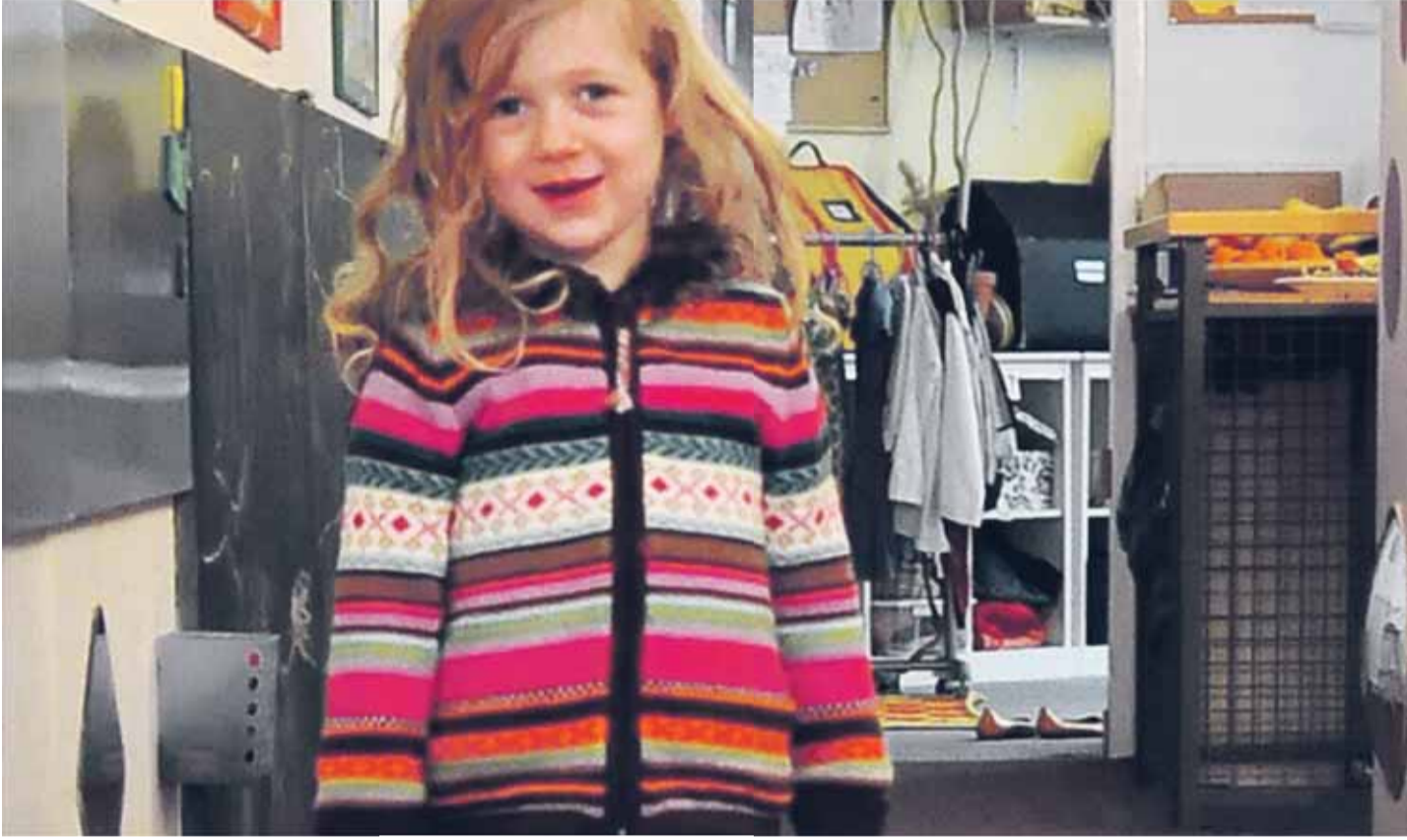
Begehrte Kita-Plätze: Berlin erhöht das Angebot weiter.

mein Kind anmelden? Zentrales Online-Portal wird jetzt geschaffen.