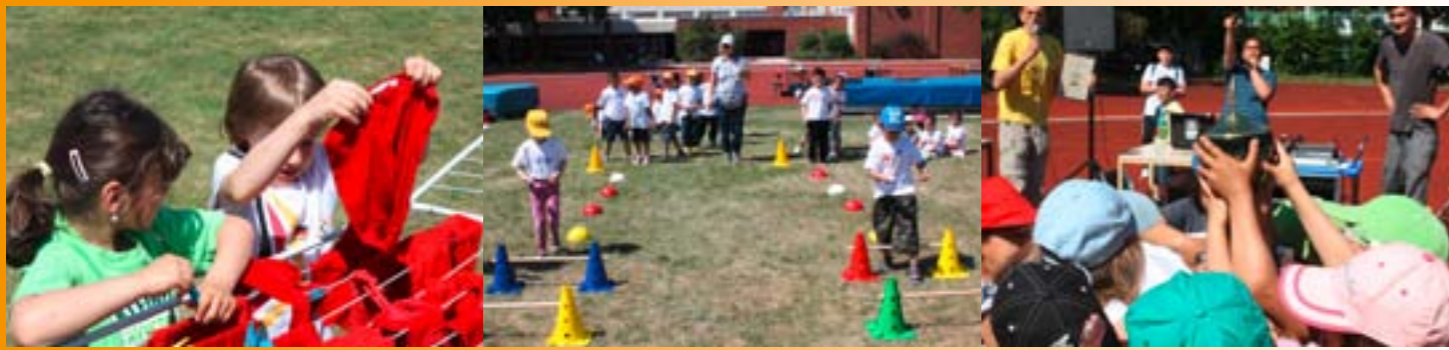
Bei der Moabiter Olympiade am 3. Mai 2012