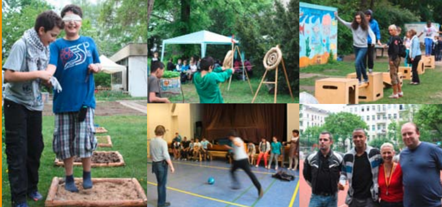
Beim Familiensportfest im Poststadion am 2. Juni 2012