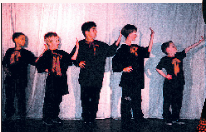
Der „Flamenco“ – getanzt von der Kindern der 1a.

An der Reinhold-Otto-Grundschule wurden innerhalb der Projektwoche von einigen Arbeitsgruppen Erweiterungen für das Theater-