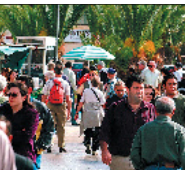
Touristen und Einheimische prominiere gern auf dem Sonntagsmarkt in Marsaxlokk.

In den nächsten Monaten wird die EU um 13 neue Mitglieder wachsen. Der punkt möchte Ihnen in einer Serie die Beitrittsländer näher vorstellen. Lesen Sie heute Teil 1: Malta.