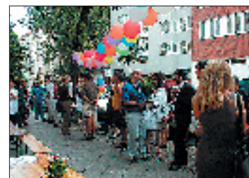
Gemütliches Beisammensein zur Einweihung des Gemeinwesenentrums.