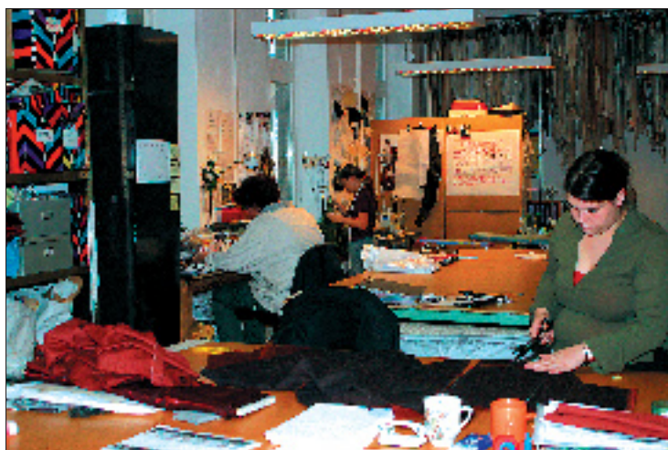
Quasi moda sind 3 Designerinnen in der WeiberWirtschaft, die seit 1989 sinnlich-souveräne Großstadtmode entwerfen.

Genossenschaften sind immer dort die adäquate Rechtsform, wo viele Individuen tatsächlich ein gleichartiges wirtschaftliches Interesse am besten gemeinsam verfolgen können. Die berühmten „Synergien“, die in anderen Unternehmen erst mühsam konzipiert werden, sind gleichsam der Gründungsgedanke der Genossenschaft. Wirklich teamorientierte Führung bedingt transparente und demokratische Entschei-