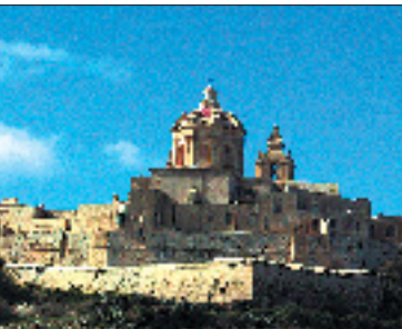
Burg: Blick auf Medina City. Medina diente dem Malteser Orden als Hauptstadt, bevor Valletta maltesische Capitale wurde.