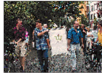
Umzug der Stadtteilgenossenschaft Wedding von der Torfstraße 11 in die Sprengelstraße 15.