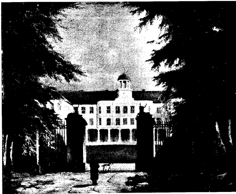
Abb. 2. Das alte Schloß in Neustrelitz. (Berlin, Schloß.)

Der am 23. März 1842 verstorbene große französische Schriftsteller Stendhal pflegte vorauszusagen, daß seine Werke erst um 1900 allgemein verstanden werden würden. Was diesem innigsten Freund Italiens und des italienischen Volkes bewußt war, hat Blechen, bescheidener und einfacher als er, von seinem Schaffen nicht ausgesprochen. Aber er ist auf dem gleichen Boden und zur selben Zeit wie Stendhal zu voller Entfaltung seiner künstlerischen Fähig-