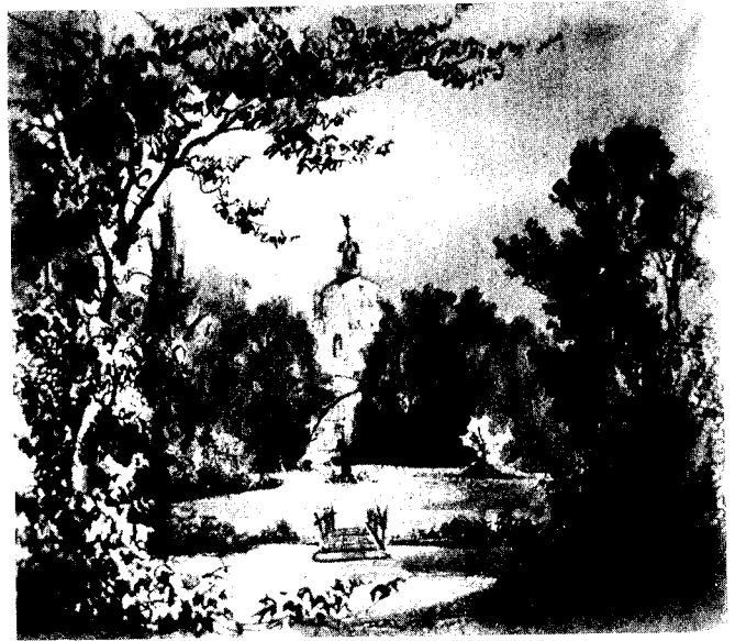
Abb. 4. Blick durch den Park auf Schloß Charlottenburg. (Nationalgalerie.)

... Als ich bei ihm gewesen war und mit den Ärzten gesprochen hatte, habe ich auf bloßem innerem Antrieb, ohne zu wissen, wie mir's möglich sein werde, das ganze Geschick des Malers auf mich genommen, ob schon ich kein Geld habe, über das ich frei disponieren könnte. So versprach ich Hilfe zu schaffen und habe seitdem einen glücklichen Anfang gemacht. Ich kaufte eine Landschaft von ihm an mich, die zwar klein, aber von der schönsten Farbenvollendung ist, eine Ansicht aus