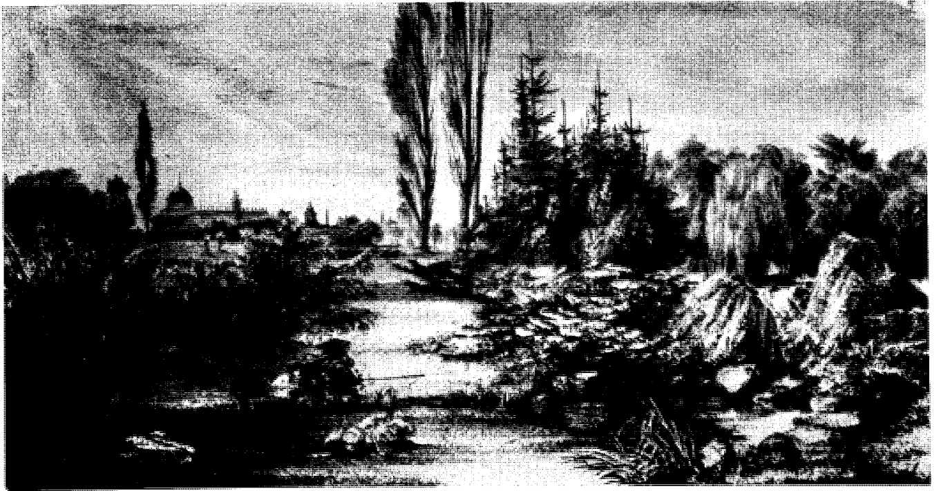
Abb. 6. Der Park mit dem ehemaligen Palaisgraben beim Neuen Palais in Potsdam.

war die Wiedergabe von einigen der zahlreichen Darstellungen Berlins und seiner Umgebung vorwiegend gehalten. Blechen, der gelegentlich der „Vater der märkischen Landschaftsmalerei“ genannt wurde, hat, allein und in Begleitung seiner Schüler, viele Wanderungen in die Mark unternommen, deren künstlerischer Niederschlag erhalten blieb. Schon zu Beginn seiner Laufbahn als Maler scheint er verschiedentlich in Eberswalde und in Chorin gewesen zu sein. Das häufige Vorkommen von verfallenen Kirchenruinen gerade in der Frühzeit ist wahrscheinlich auf den starken Eindruck der damals noch nicht instand gesetzten Kloosterruine in Chorin zurückzuführen. Dem Aufenthalt in Eberswalde verdanken wir auch das erste Gemälde einer deutschen Industrielandchaft: Blechen hat der Darstellung des Messing-Walzwerks am Finowkanal mehrere Studien gewidmet; ihr Ergebnis ist das höchst eindrucksvolle kleine Gemälde der Nationalgalerie, das wie kaum ein anderes die sittengeschichtliche Eigenart und die vollkommene Gleichordnung alles Bestehenden in seiner Kunst kennzeichnet (1803).