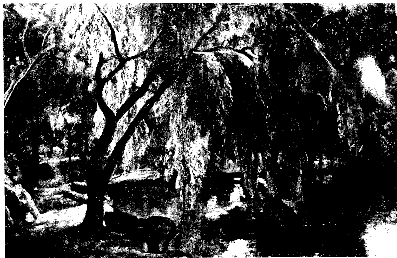
Abb. 8. Weidenbaum (am Neuen See?) im Tiergarten. (Privatbesitz.)

Größe: 5 Fuß 6 Zoll. Haare: schwarzbraun. Stirn: frei. Augenbrauen: braun. Augen: blau. Nase: stark. Mund: mittel. Bart: braun. Kinn: rund. Gesicht: oval. Gesichtsfarbe: gesund. Statur: groß. Besondere Kennzeichen: ohne.