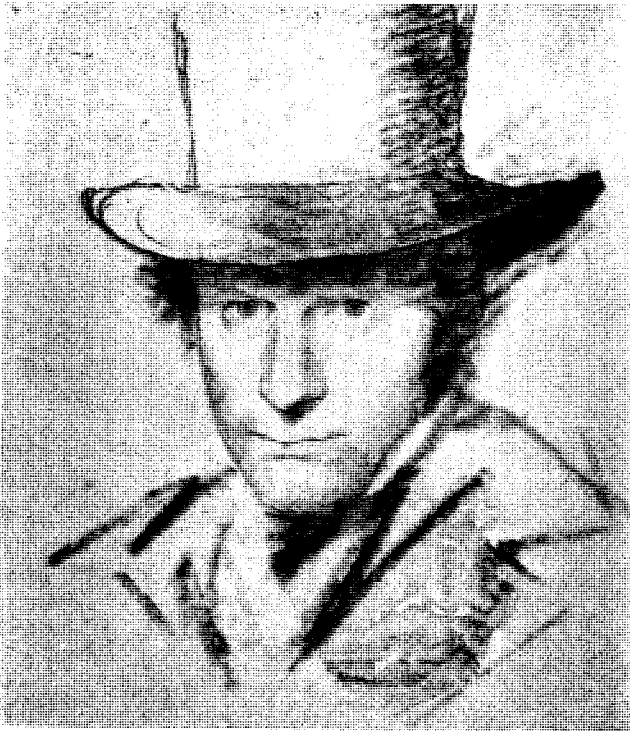
Abb. 1. Karl Blechen. Selbstbildnis. (Nationalgalerie.)