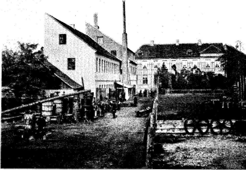
Abb. 2. Rungestraße 17. Im Hintergrund Gartenseite des Schlüter'schen Hauses. Im Vordergrund die Schlüter'sche Maschinenfabrik in der Köpenicker Straße 71 (Golfshof).

die Jahrzehnte seiner Zugehörigkeit ein auf Sitzungen selten fehlendes Mitglied. Im Jahre 1935 wurde ihm die Bronzene Medaille verliehen und im Jahre 1937 die Ehrenmitgliedschaft. Zur Vollendung seines 80. Lebensjahres verlieh ihm der Reichssportführer v. Tschammer-Osten die höchste Anerkennung des Reichsbundes für Leibesübungen: den Großen Ehrenbrief.