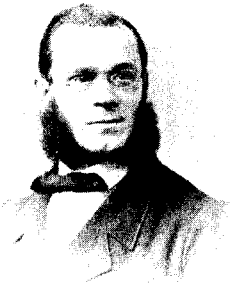
Abb. 1. Otto Göriz im Jahre 1870.

Als Freund der Kinder und der Bücher trug er die Kraft in sich, die das Lehrerherz erfüllen muß. „Liebe zur Kinderwelt“, schreibt er einmal, „war meine einzige unüberwindliche Leidenschaft. Nur einmal im Leben durchzitterte ein leises Liebeswiehen zu einer aufblühenden Jungfrau mein Gemüt.“