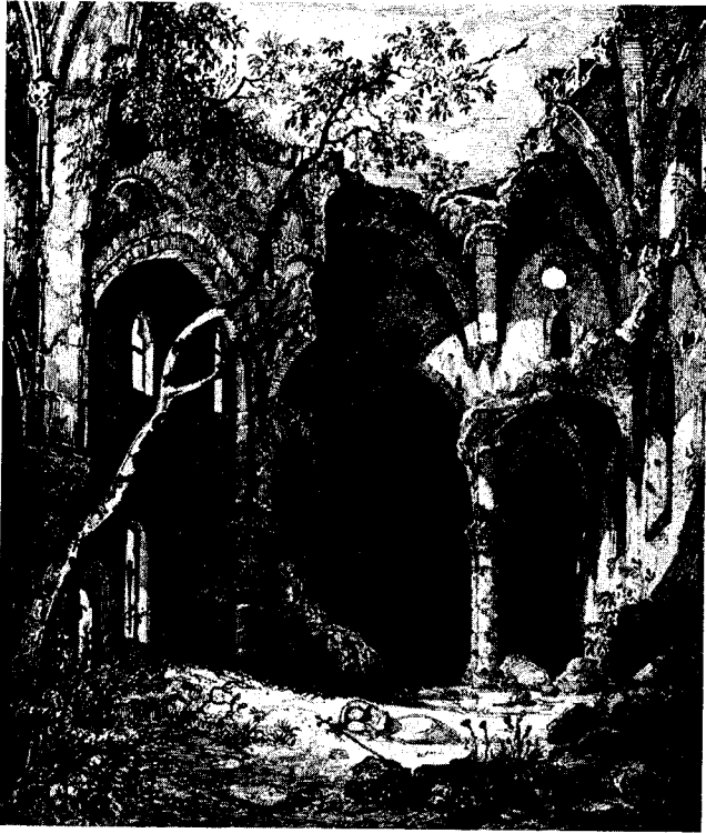
Abb. 5. Kirchenruine mit schlafendem Pilger. (Privatbesitz).

umbuchtet, seine kühlen Farben spiegelt! Wie schön ist dieses Bild! Sie waren ja dort, Sie werden sich der Linien noch erinnern, die sich am Horizont über dem Meer wegswingen, von den Felswänden, auf denen die Burg des Tiberius liegt, die die ersten Sonnenstrahlen auffängt am Morgen und sie bis zum Untergang einsaugt. Wie da alles in der heißen Stille unbeweglich ruht. Nur der Fischertnabe liegt auf dem glühenden Stein, auf der Zither klimpernd, und das Mädchen gibt träumend ein halb Gehör. Alles ist Wiederhall in der Natur, denn die Empfindungen, die sie aufruft in dem Beschauenden, sind das Gepräge ihres Geistes in seiner Seele, die, von ihrer Schönheit erfüllt, einen Klang gibt, aus dem wir die Stimme Gottes vernehmen. Der Maler, der damals dies Capri mit seinen Sinnen aufsaßte und später auf der Leinwand diesen Eindruck aussprach, gibt Zeugnis von der Stimme, die an sein Herz sprach. Wie könnten uns sonst Kunstwerke rühren mehr als die Natur, wenn selbst in unvollkommenen Versuchen, als bloß, weil wir erschüttert sind, daß die Gewalt des Geistes, der alles geschaffen hat, hier in der Phantasie des Malers als in einem Siegel sich abbildet! Dieser Widerklang des Göttlichen aus der Seele eines Menschen rührt uns, und darum lieben wir die Kunst und in der Kunst nur dies, und alles andere ist Einbildung.